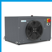
PC 2500 2.5 kW