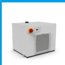
CPC 1600 1.6 kW

Noch mehr Informationen zum CPC 1600 und unseren weiteren Rückkühlösungen finden Sie online auf unserer Produktdetailseite .