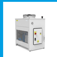
EB 2.0 L 21-44 kW