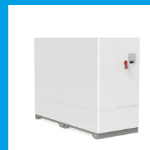
EB XT 36-150 kW